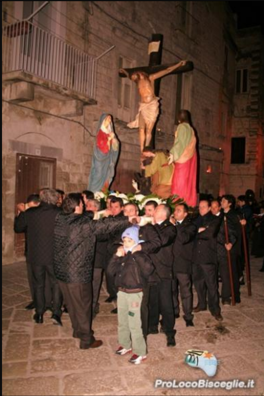
KRISTU MISLUB QIEGHED AGUNIJA