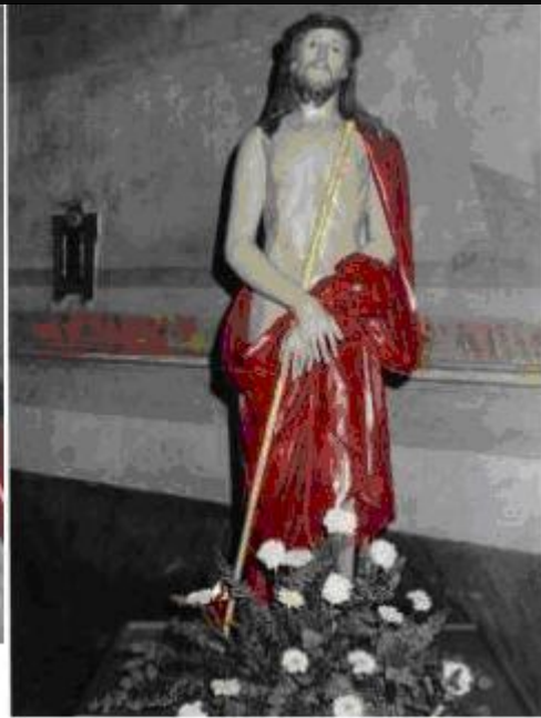
KRISTU NKURUNAT BIX-XEWK