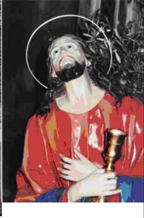
KRISTU GEWWA L-GNIEN TAL-GETSEMANI