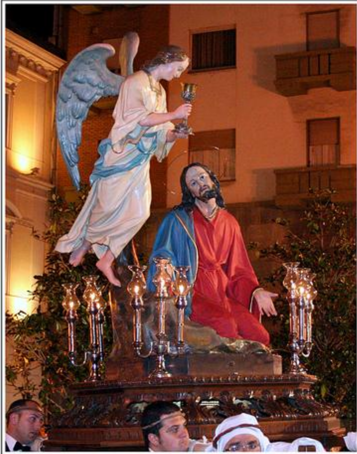
Taranto: i riti della Settimana Santa