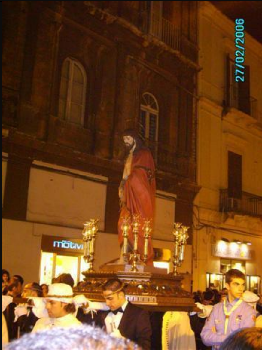
KRISTU NKURUNAT BIX-XEWK